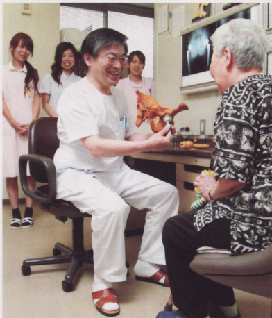
実物の人工関節を使用し、病状や治療法など丁寧に説明。