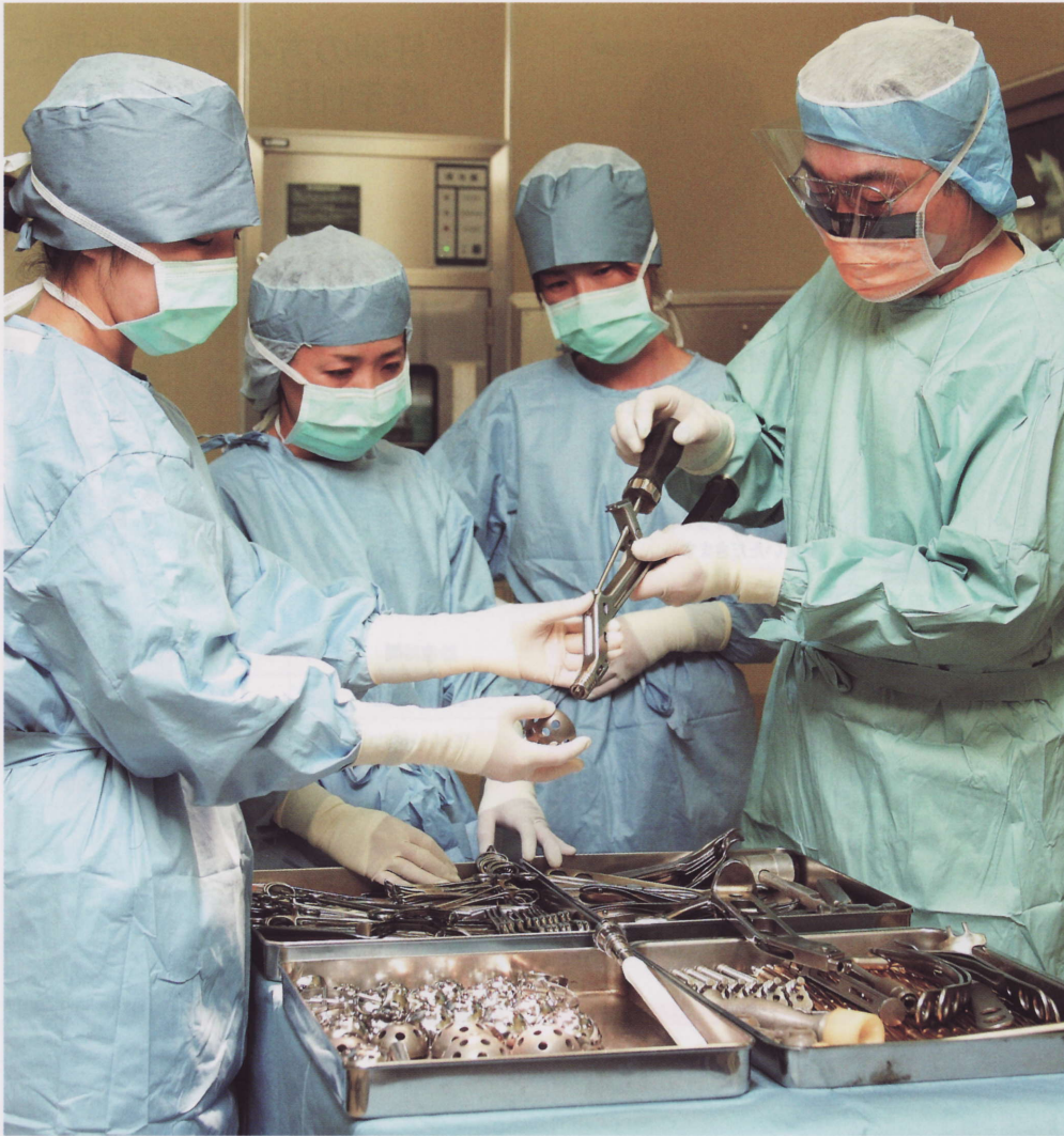
「MIS」のための特殊用具を始めとして、充実した設備の中、熟練のスタッフでバックアップされて手術がとりおこなわれる。