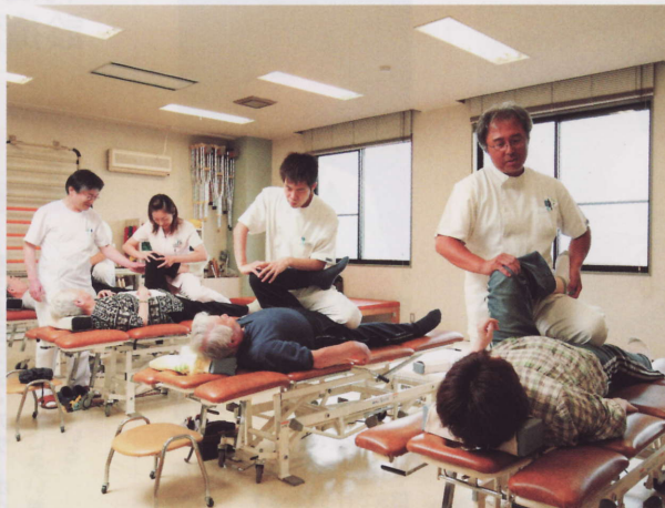
広々としたリハビリ室にて、医療療法士の指導の元、安心してリハビリを進められる。